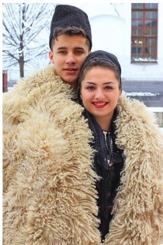
De Dragobete, „Tineri din Vaideeni”